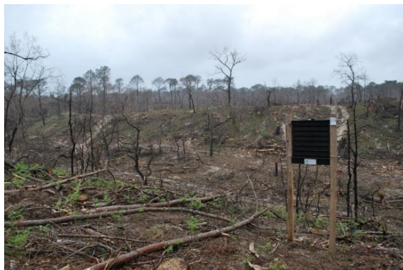
Figure 2 Piège à La Teste-de-Buch

Un piège à La Teste a récemment été vidé de ses captures.