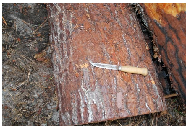
Figure 2 Amas de sciure indiquant une attaque sur grume