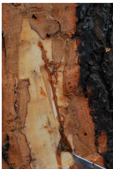
Figure 1 Chambre d'accouplement et galerie maternelle avec encoches de pont

aquitaine.agriculture.gouv.fr/IMG/pdf/carte_et_coordonnees_2023_des_correspondants_observateurs_de_la_nouvelle-aquitaine.pdf